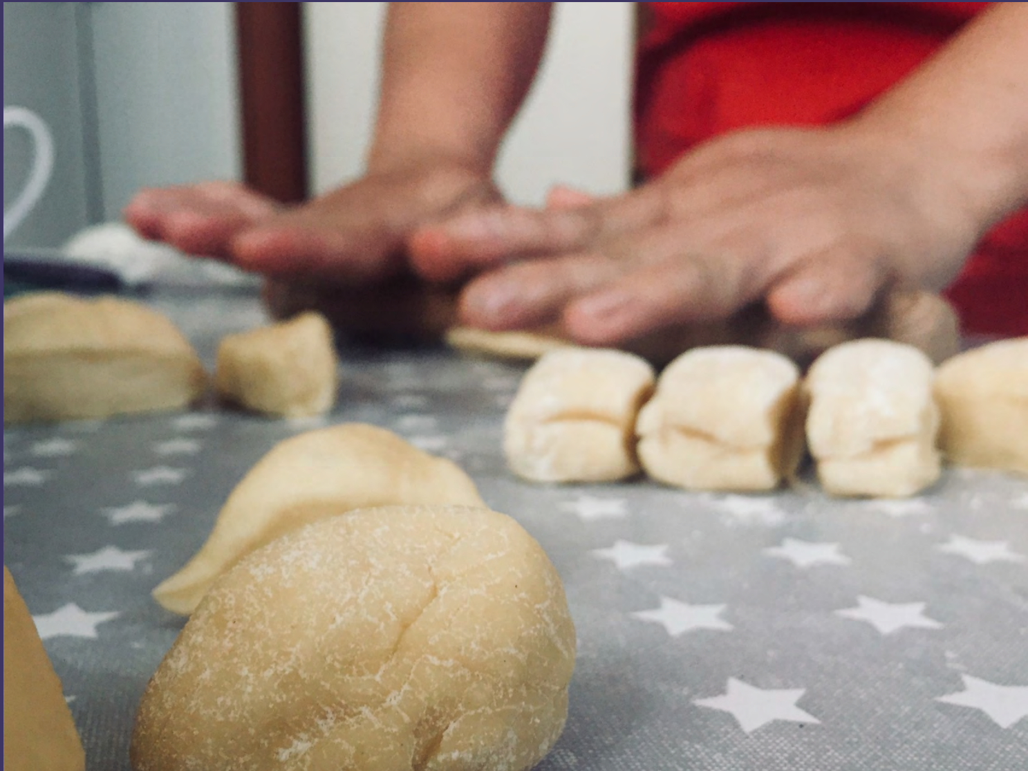
REBECCA RAMIREZ - DESERTE STRADE, CASE ILLUMINATE 7