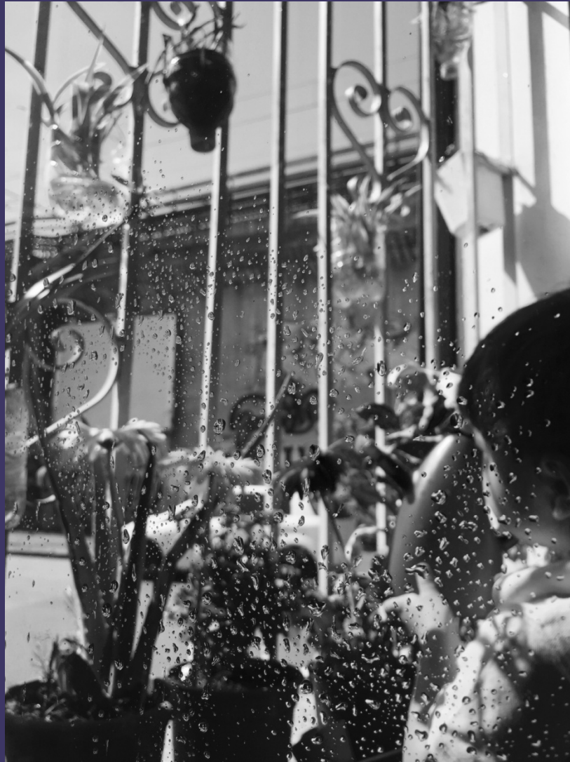
REBECCA RAMIREZ - DESERTE STRADE, CASE ILLUMINATE 4