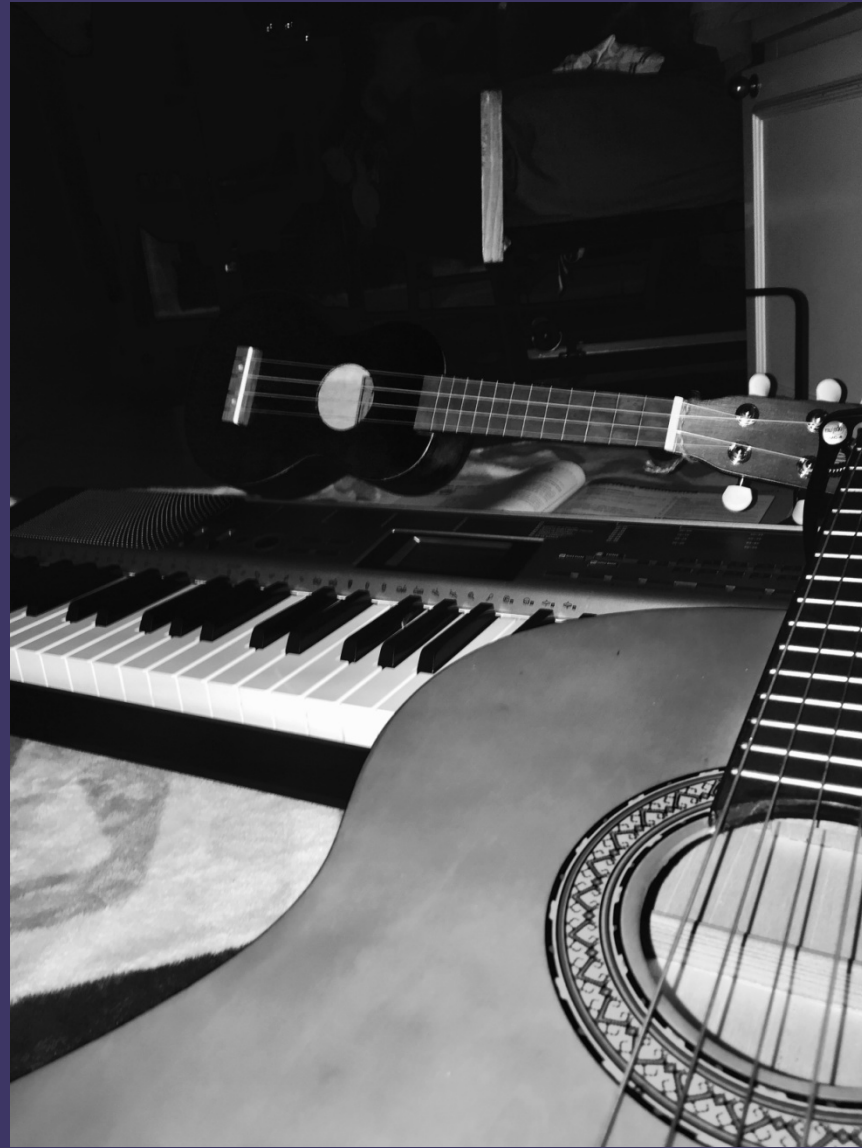
REBECCA RAMIREZ - DESERTE STRADE, CASE ILLUMINATE 2