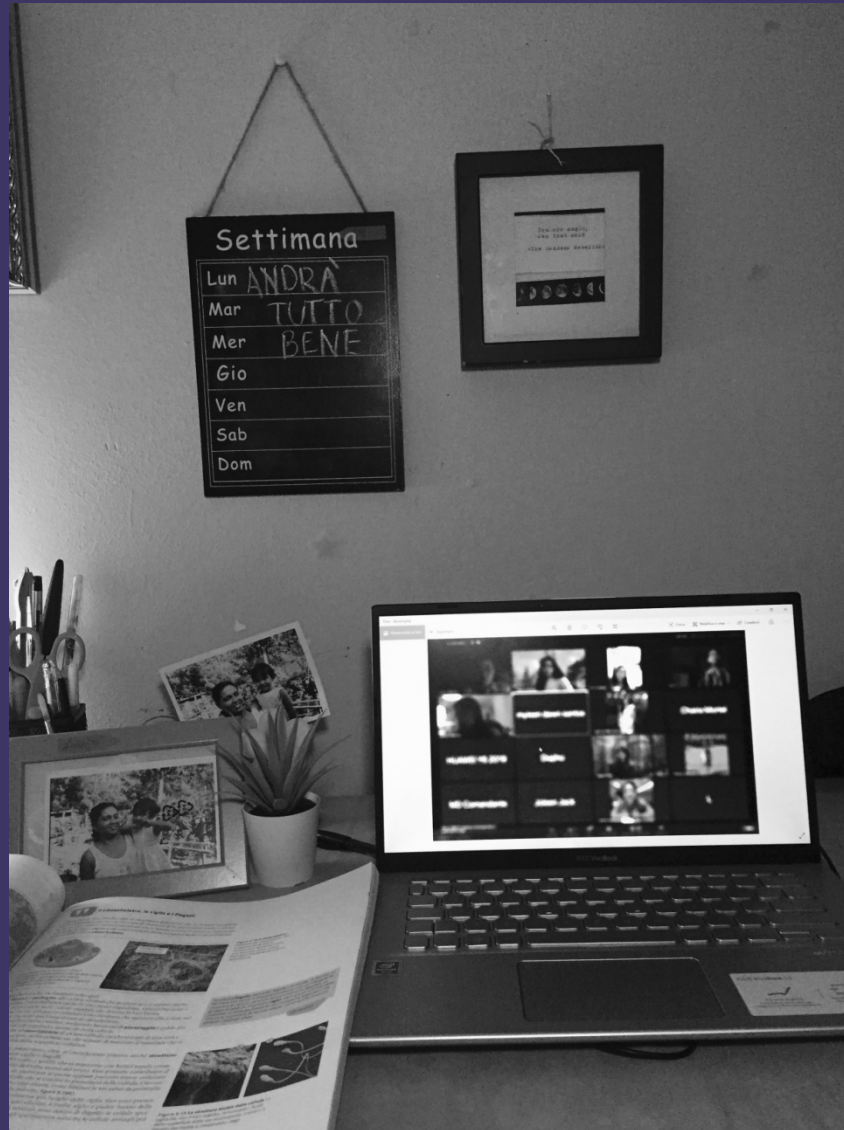
REBECCA RAMIREZ - DESERTE STRADE, CASE ILLUMINATE 6