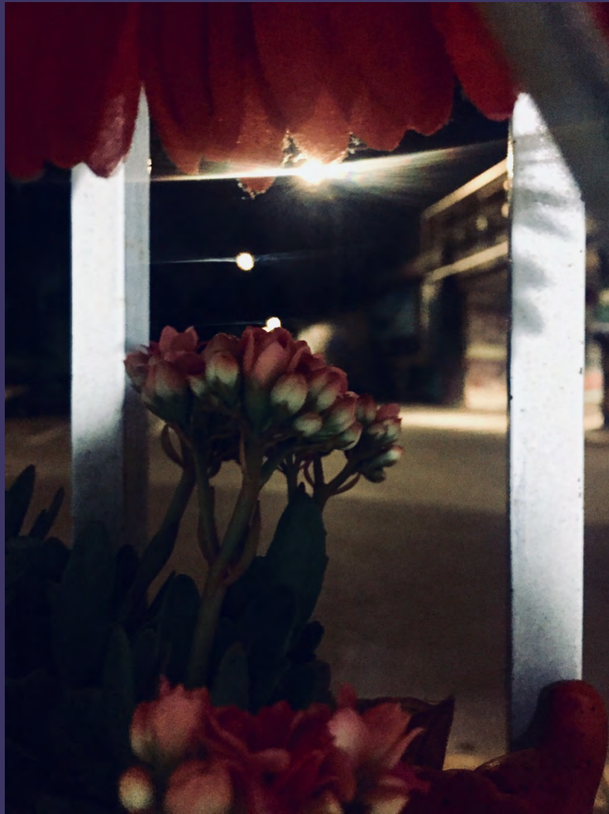
REBECCA RAMIREZ - DESERTE STRADE, CASE ILLUMINATE 1