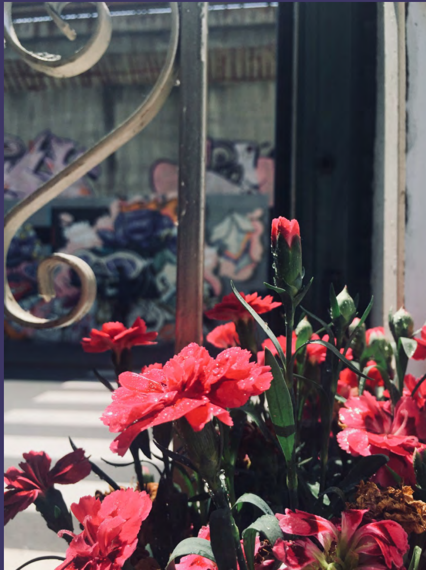
REBECCA RAMIREZ - DESERTE STRADE, CASE ILLUMINATE 5