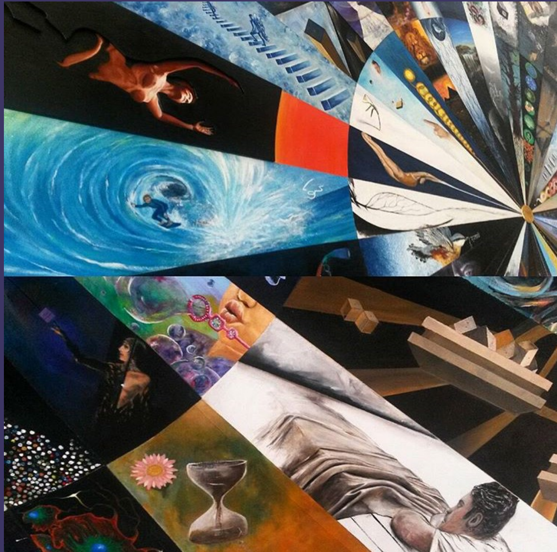
Alessia Castro Ponte fra colori